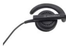
BDN6720 – Flexibilis fülhallgató

számára. A CP180 64 csatornával rendelkezik a maximális rugalmasság érdekében, valamint egy 8 karakteres háttérvilágításos starburst kijelzővel és 10 könnyen érthető ikonnal. A teljes billentyűzet azonnali privát, ill. csoporthívásokat tesz lehetővé, valamint elérést a menühöz és a kontaktlistához, amely telefonkönyvként funkcionál. A felhasználó a kijelzőn megjelenő „csatornaazonosító” alapján meg tudja határozni ki a hívó fél. A billentyűzet beállítható azonnali gyorshívásra, mellyel a leggyakrabban hívott egyének vagy csoportok elérése lehetséges. A billentyűzár megakadályozza a billentyűzet véletlenszerű lenyomásából adódó hívásokat és a beállítások változtatását, így a felhasználó állandóan elérhető.