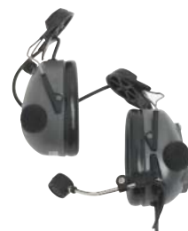
RMN4053 – Nagy igénybevételre tervezett fejlesztett, passzív fülvédővel (szürke)