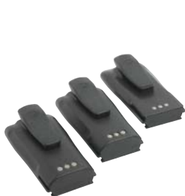
Li Ion, NiCd és NiMH akkumulátorok