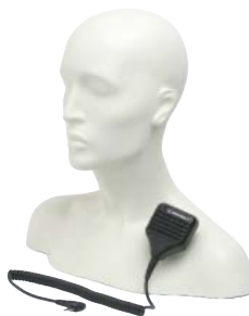
HMN9030 – Külső kezelő