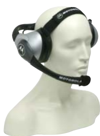
RMN5015 – Nagy igénybevételre tervezett verseny fejszett (RKN4090 fejszett adapter kábel szükséges)