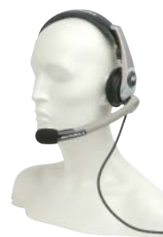
RLN5238 – Közepes fejszett PTT-vel