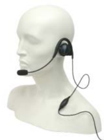
MDPMLN4444 – Mag One flexibilis fűszett belső PTT/VOX kapcsolóval