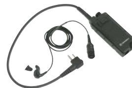
BDN6646 – PTTs fülmikrofon és standard fülhallgató